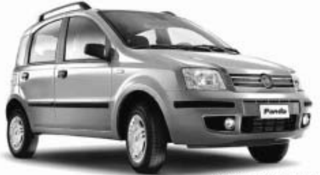
Abb. enthält Sonderausstattung.

JETZT BIS ZU 2.500,- € UMWELT- PRÄMIE KASSIEREN.*