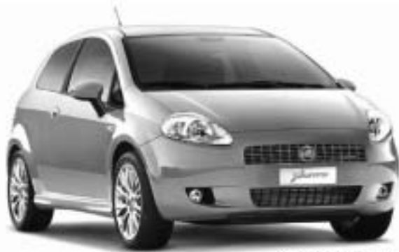
Abb. enthält Sonderausstattung.

JETZT BIS ZU 3.000,- € UMWELT- PRÄMIE KASSIEREN.*