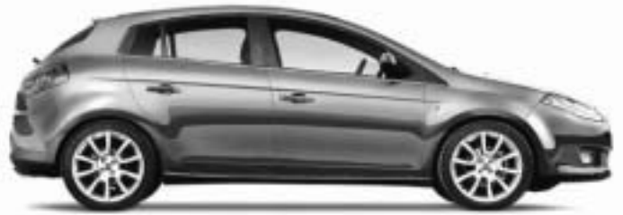
Abb. enthält Sonderausstattung.

JETZT BIS ZU 3.000,- € UMWELT- PRÄMIE KASSIEREN.*